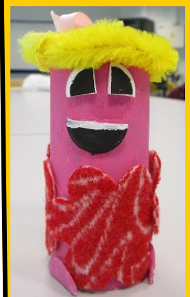
de ce numéro réalisée par Pénélope.