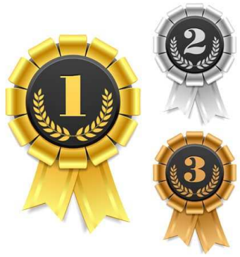
L'excellence dans la voie Pro