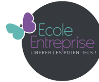
Relations avec le tissu économique local