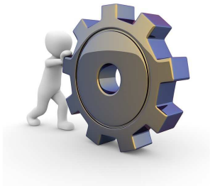
Les moyens pour accompagner